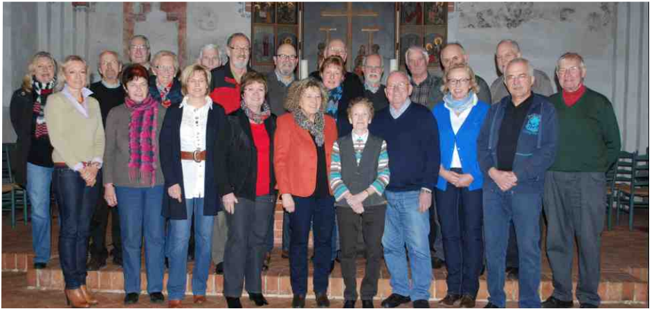
Ein großer Teil der Mitglieder des "Arbeitskreises Offene Kirche" (A.O.K.)

Ihre Intention ist ganz unterschiedlich. Es sind Urlaubsgäste, die sich das imposante