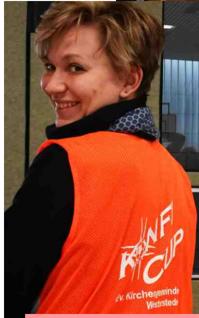
Es gab viele kleine und große Helfer