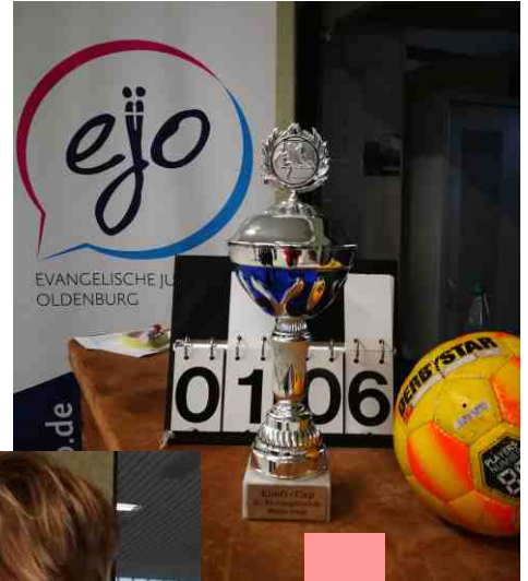
Der begehrte Pokal