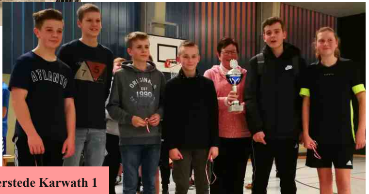
Das Siegerteam Westerstede Karwath 1

"Gott gab uns Hände, damit sie halten, er gab uns Füße zum Fußballspiel'n" und . "Komm, Herr, segne uns ... siegen und verlieren wird gesegnet sein"